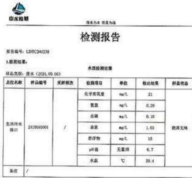
图 5.2.1 废水检测结果